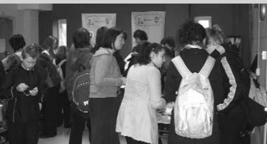
Plant o Ysgol Dyffryn Nantlle yn rhoi eu barn

Bu diwrnod llwyddiannus iawn yng Nghanolfan Gymdeithasol Talysarn dydd Iau 15fed Chwefror 2007. Cynhaliwyd diwrnod o wybodaeth am Ddiogelwch Cymunedol a daeth tua 30 o asiantaethau ynghyd i gyflwyno gwybodaeth i'r cyhoedd. Cafodd disgyblion ysgolion cynradd Talysarn a Nantlle ynghyd a rhai disgyblion o Ysgol Dyffryn Nantlle y cyfle i flasgu bwrllwm y diwrnod a chymryd rhan yn rhai o'r gweithgareddau.