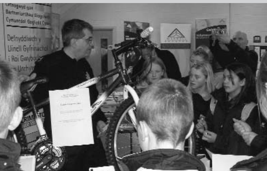
Y plant yn cael gwrs am ddiogelwch ar feic