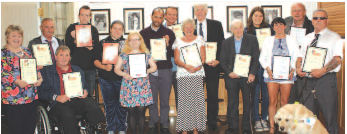
Y gwirfoddolwyr oedd wedi derbyn eu tystysgrifau yn 2016