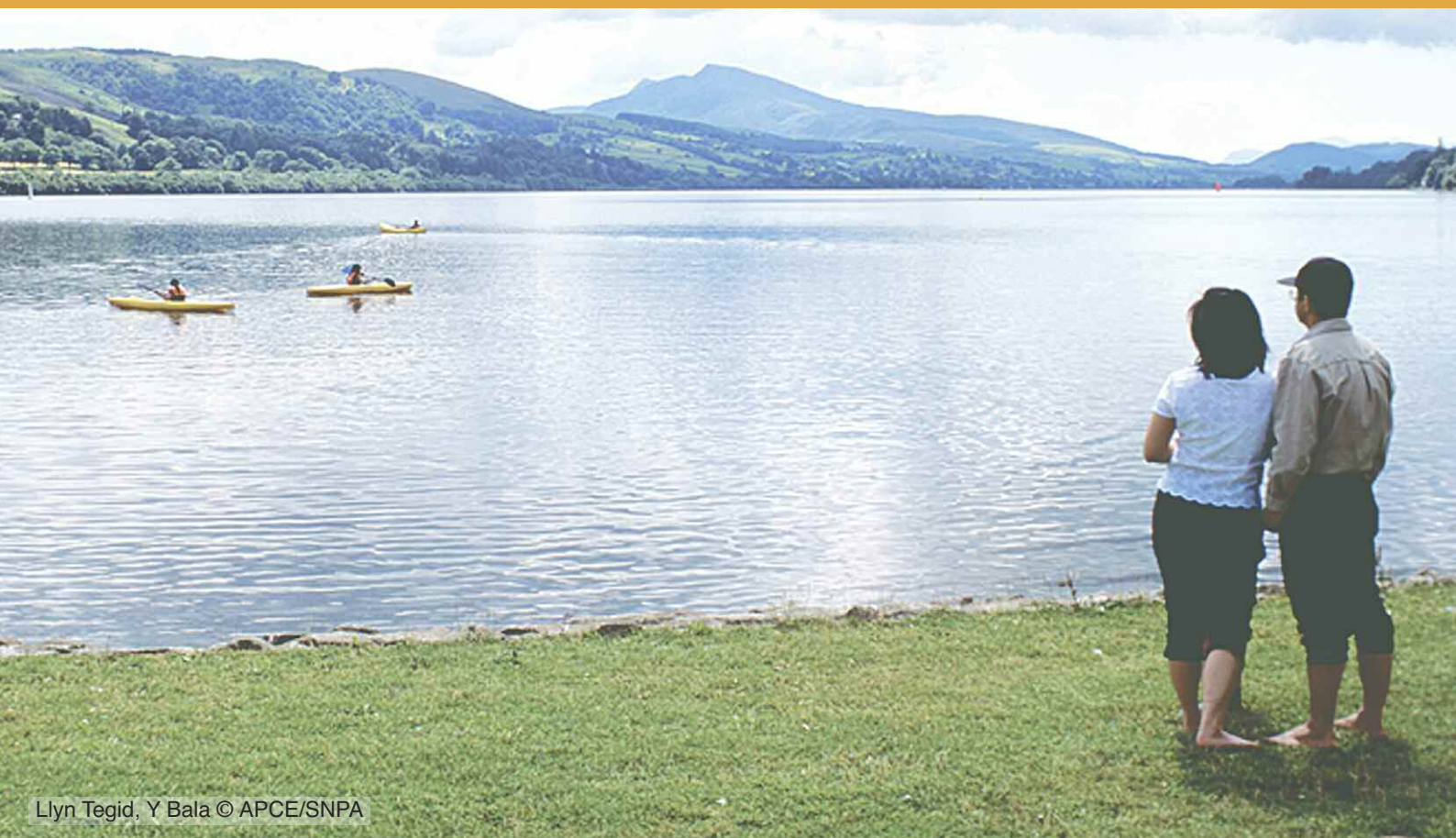
Llyn Tegid, Y Bala