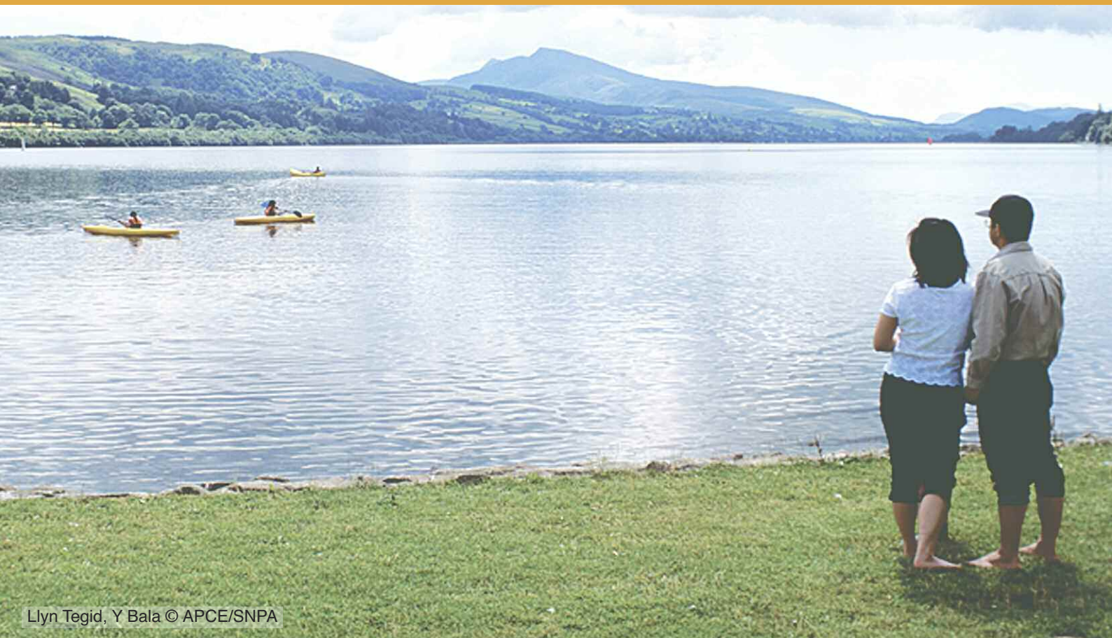
Llyn Tegid, Y Bala