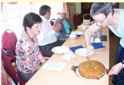
Mwynhau'r Te yng Nghraflwyn!

Yn ôl yr arfer uchafbwynt yr wythnos oedd y Te Dathlu a Diolch , ac eleni treuliodd odd-eutu 40 ohonom brynhawn godidog o braf yng Nghraflwyn yn Meddgelert. Ein siaradwr gwadd oedd y Cynghorydd Richard Parry Hughes - Arweinydd Cyngor Gwynedd (a chwarae teg iddo am fynychu a hithau yn ddiwrnod ei ben-blwydd!!).