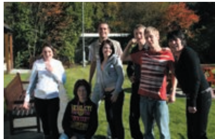
Theatr Fforwm Gisda fu'n perfformio ar y diwrnod